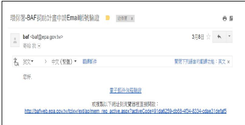
圖 3 電子郵件信箱驗證。

4.欄位資料輸入完成後，按 傳送註冊資料 後，系統將自動寄送認證信至輸入之 Email 信箱，按「電子郵件信箱驗證」，即代表註冊完成。