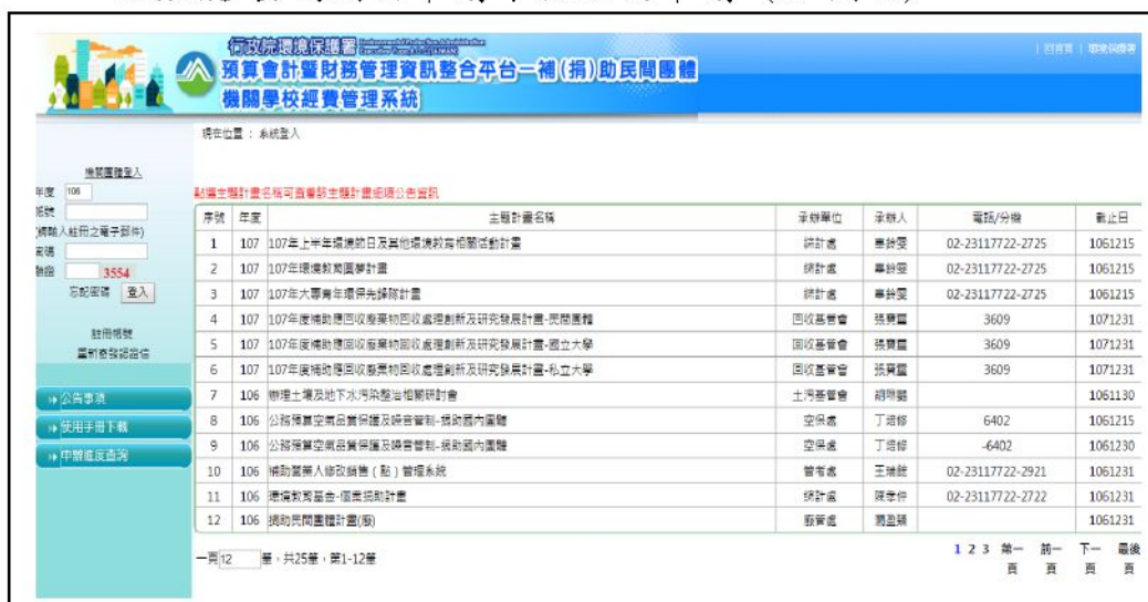
圖 1 補(捐)助民間團體學校機關經費管理系統登入首頁