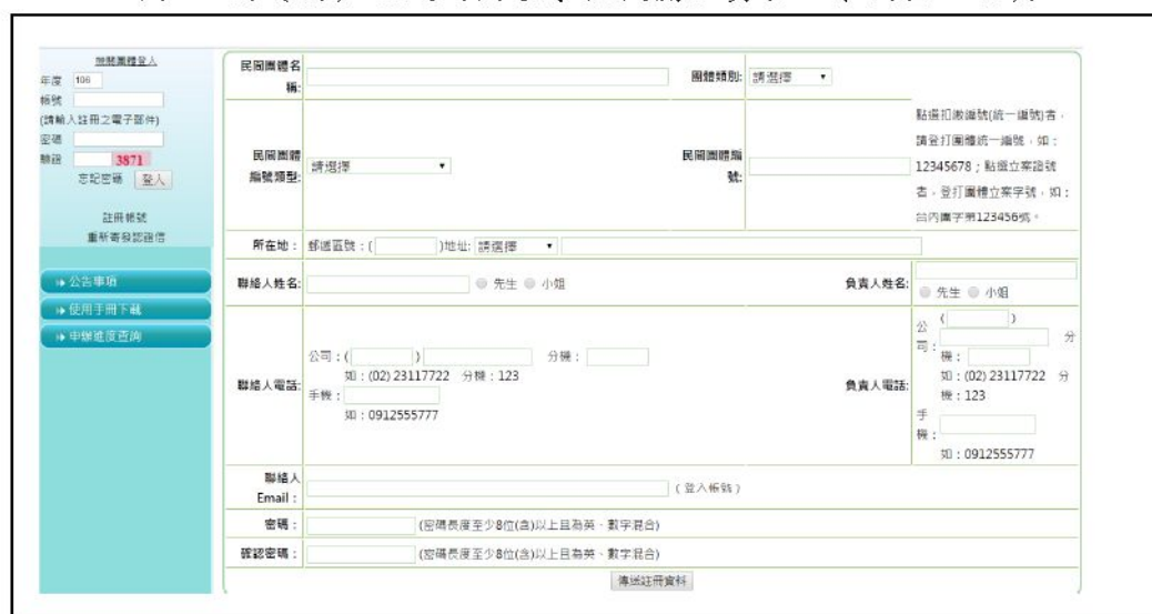
圖 2 申請帳號/密碼基本資料建立